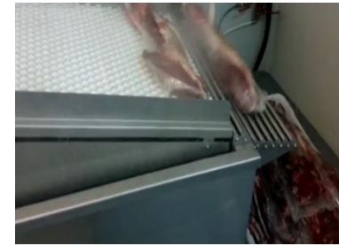
Bandeja rodillos de salida producto