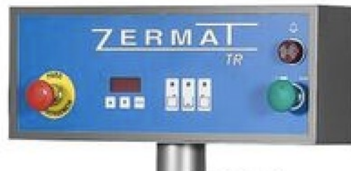
Panel de control simple e intuitivo 10 programas editables