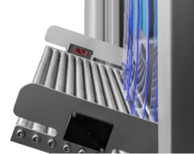
Bandeja de entrada con fotodetector