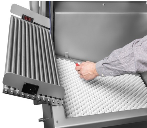
Bandeja interior inclinada de fácil extracción