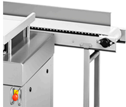
AUTOMATIZACION DE DESCARGA POSTERIOR